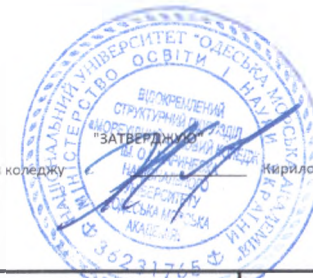
Список педагогічних працівників ВСП "МФК ім. О.І. Маринеска МУ "ОМА", які підлягають атестації (позачергово) у 2023/2024 н.р. Строк проведення атестації до 01.04.24 р.